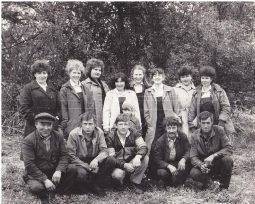
Агитбригада на полевом стане

Очень активно работали агитбригады, которые просуществовали вплоть до 90-х годов.